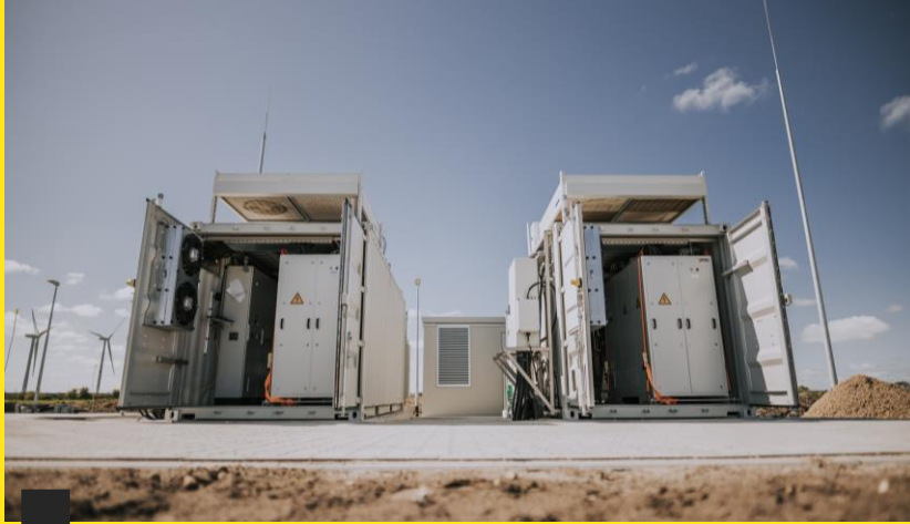
H2 erzeugen: Elektrolyse/Verdichtung am Windpark