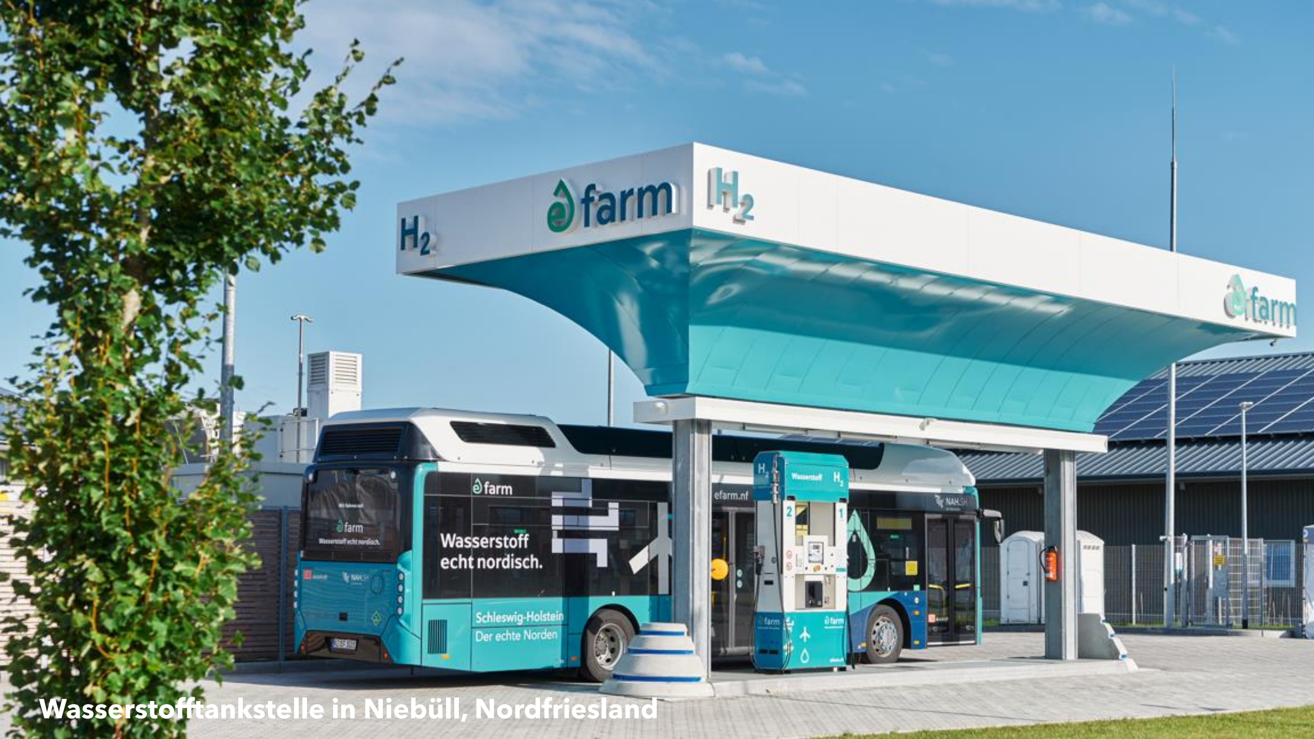
Wasserstofftankstelle in Niebüll, Nordfriesland