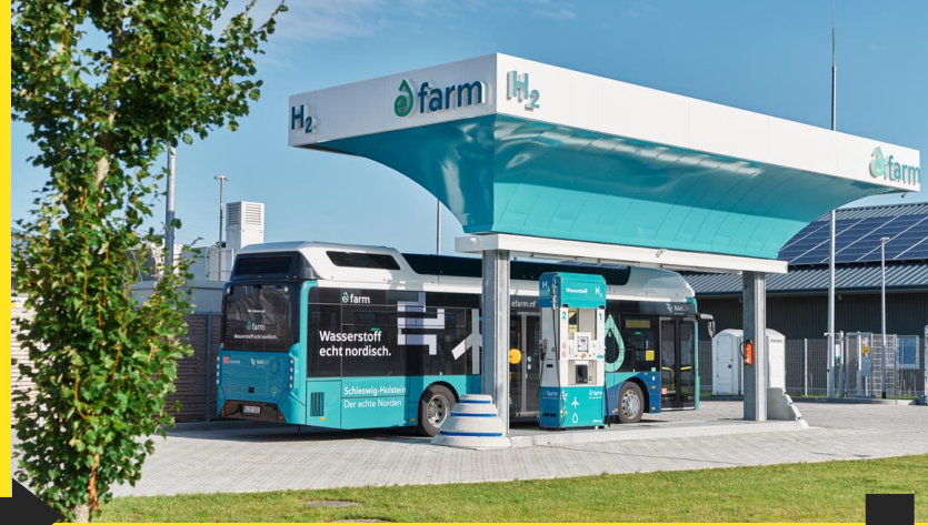
H2 verarbeiten: H2-Tankstelle in Niebüll