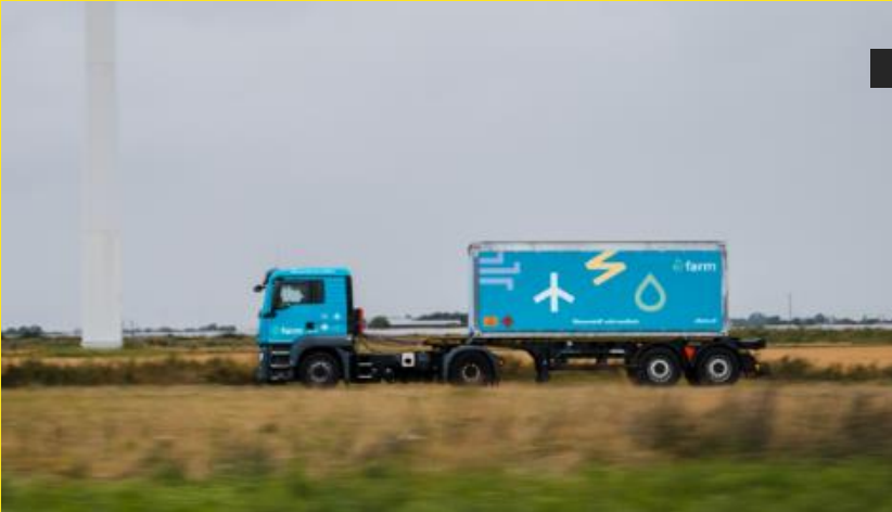
H2 transportieren: System zum Transport