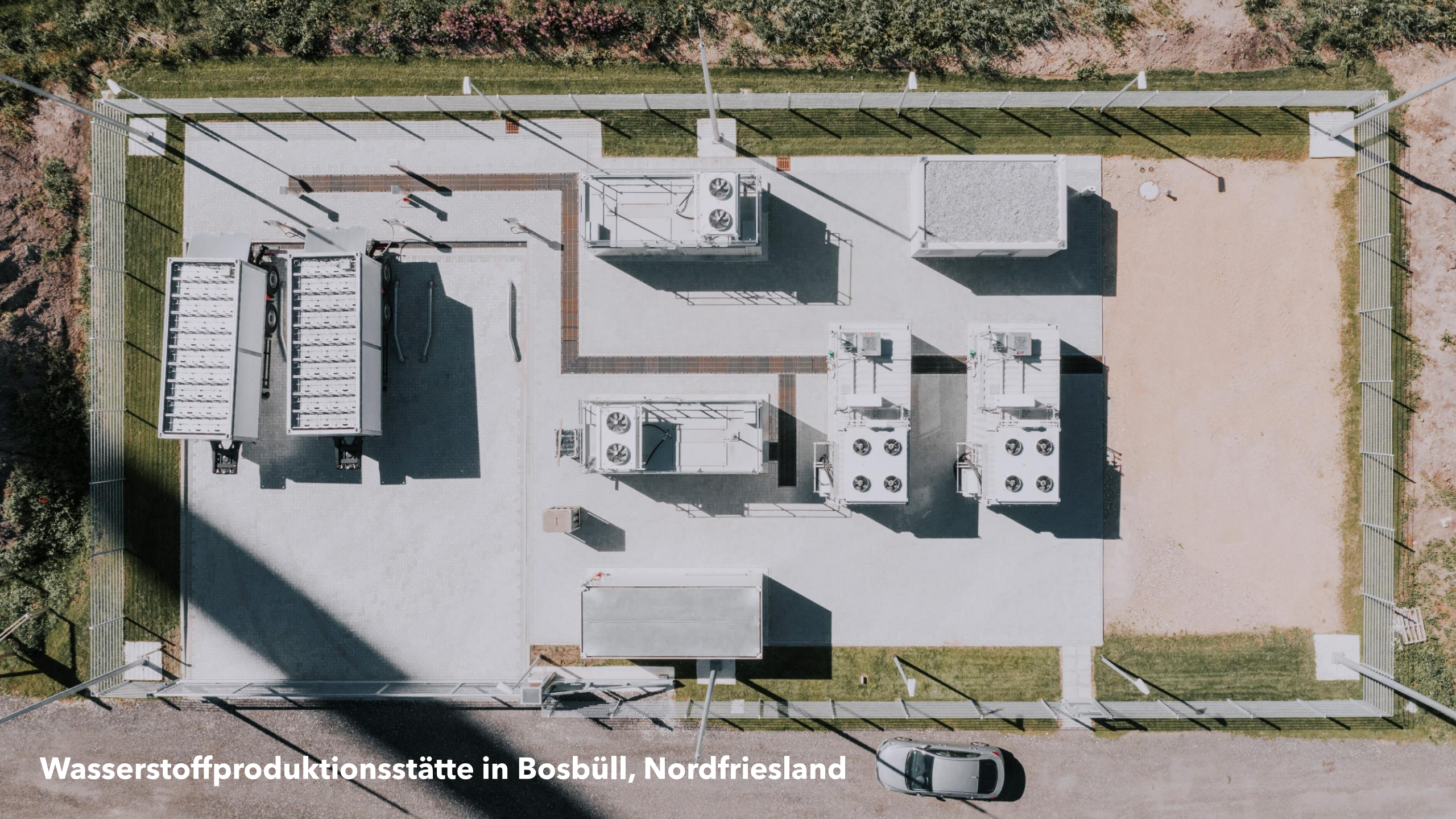
Wasserstoffproduktionsstätte in Bosbüll, Nordfriesland